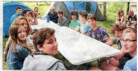
Quatorze jeunes s'immergent dans l'ambiance du festival.