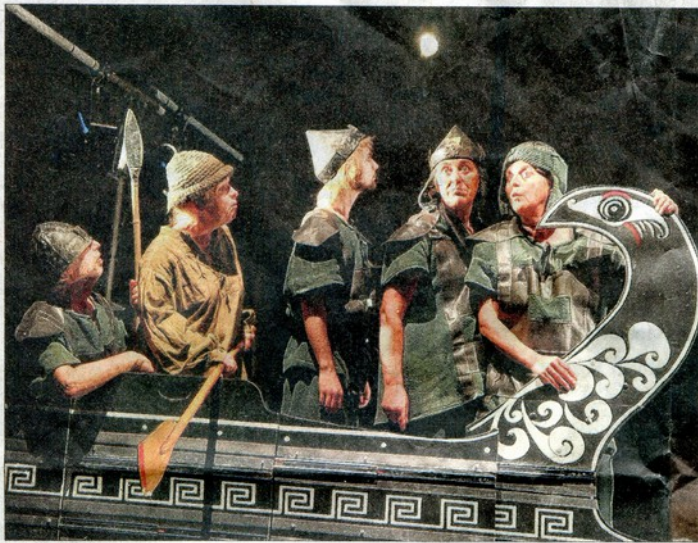
Lors de l'interprétation de "L'Odyssée pour une tasse de thé".